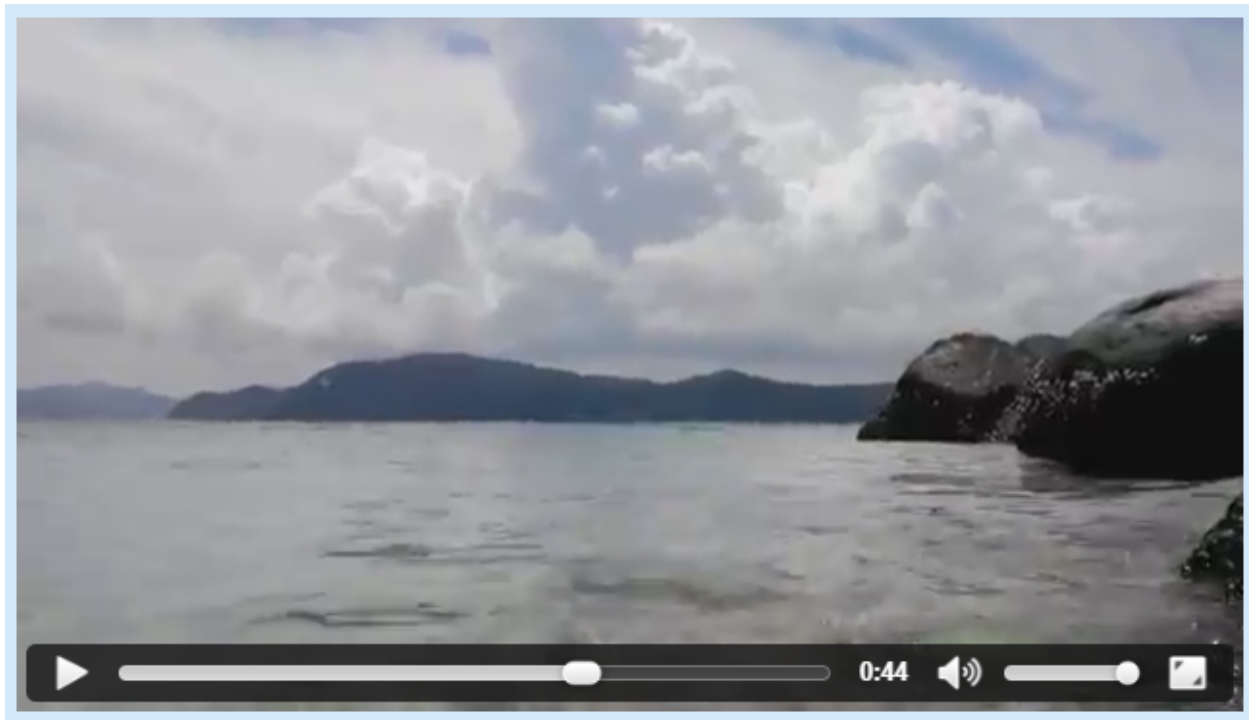
Рис. 2. Видеопроеигрыватель

Кроме общих с элементом <audio> атрибутов, элемент <video> имеет три собственных: height , width и poster .